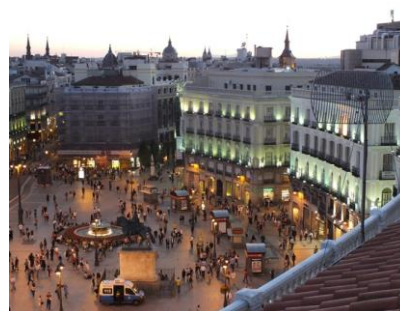
levendige Puerta del Sol.

Daarna transfer naar ons hotel voor check-in en kamerverdeling. Avondmaal en overnachting.